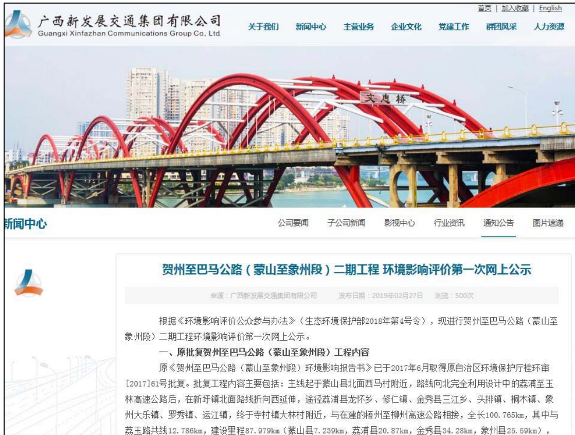
图2.2-1 第一次网上公示截图

网站公示:广西新发展交通集团有限公司网站( http://www.gxxfz.com ),属于建设单位上级集团公司网站。