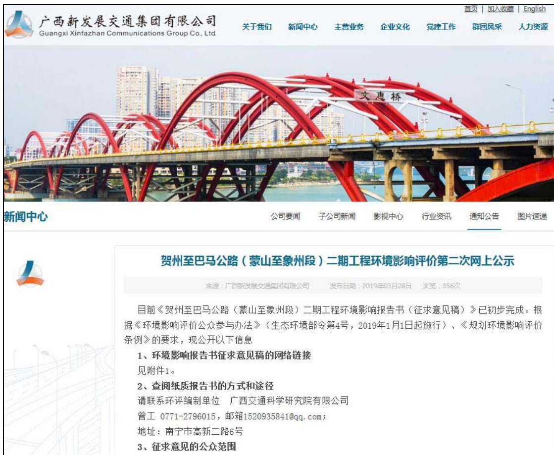
图3.2-1 第二次网上公示截图